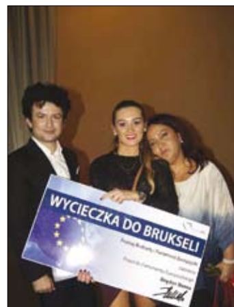
Laureatka konkursu (w środku) w nagrodę pojedzie do Brukseli

Organizatorem konkursu byli: Zespół Szkół Pro-Fil oraz Wojewódzki Dom Kultury w Kielcach. Modelki wystąpiły w sukniach ślubnych z kieleckich salonów Promariage i Pronuptia.