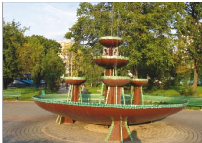
Na zdjęciu: fontanna na skwerze przy ul. Źródłowej i Sandomierskiej

Modernizacja i przebudowa skweru na skrzyżowaniu ulic Sandomierskiej i Źródłowej tzw. „lotniska” – to przyszłoroczna inwestycja miasta, w ramach budżetu obywatelskiego. Zagłosowało na nią 3423 osoby. Z pewnością byli wśród nich mieszkańcy KSM. Na inwestycję przeznaczono w budżecie 400 tys. złotych.