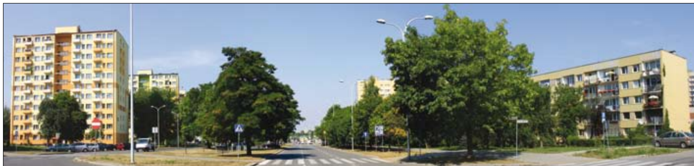
Skrzyżowanie ul. Sandomierskiej z Daleką

Zmiana regulaminów, rewitalizacja osiedli, ogrzewanie