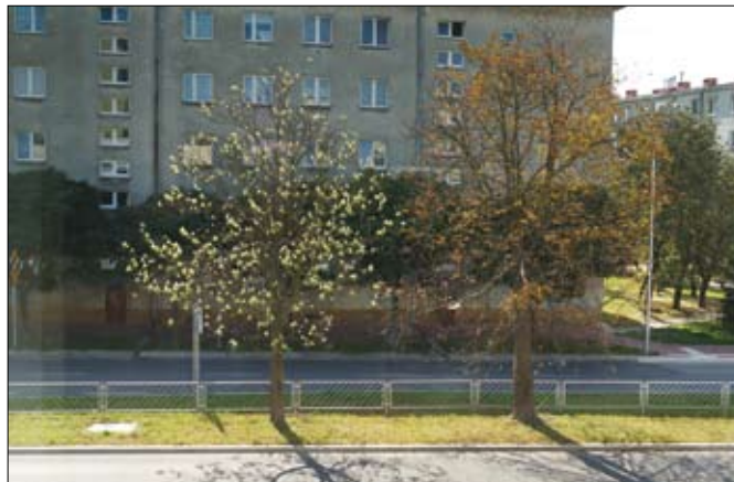
Na ul. Poczieszka kasztany zakwitły ponownie... we wrześniu.