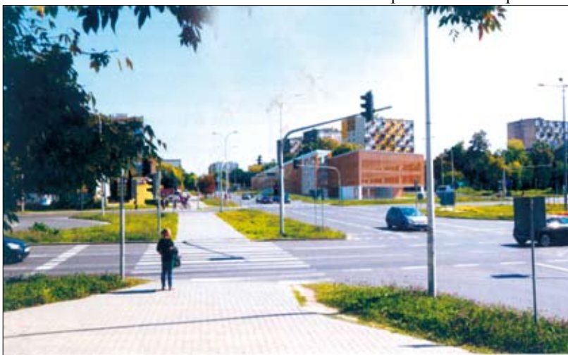
Ul. Sandomierska – projektowany parking na 400 aut nie zyskał aprobaty mieszkańców. Wizualizacja – Wydawnictwo Urzędu Miasta Kielce „Park & Ride”

Jednak, chociaż konsultacje przebiegły pozytywnie, problemem okazały się pieniądze. A raczej ich brak.