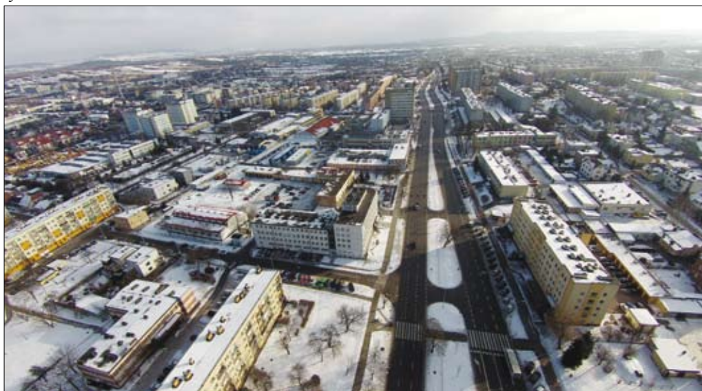
Osiedle Sandomierskie

Obowiązki lustratora może pełnić osoba, która uzyskała uprawnienia lustracyjne wydane przez Krajową Radę Spółdzielczą. Ustawą z dnia 20 lipca 2017 roku o zmianie ustawy o spółdzielniach mieszkaniowych, ustawy – kodeks postępowania cywilnego i ustawy - Prawo spółdzielcze doprecyzowano ponadto, że lustratorem nie może być osoba będąca członkiem zarządu jakiegokolwiek spółdzielni mieszkaniowej, prokurentem, likwidatorem, a także zatrudniony lub świadczący usługi na rzecz jakiegokolwiek spółdzielni mieszkaniowej główny księgowy, radca prawny lub adwokat. Zakaz ten stosuje się także do