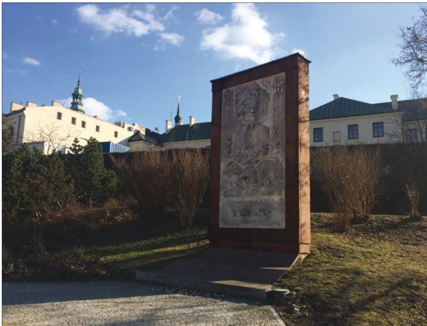
Na zdjęciach: płyta poświęcona Tadeuszowi Kościuszce przy ul. Kapitulnej, tuż obok muru okalającego Pałac Biskupów Krakowskich

współtwórców i obrońców miało miejsce nie tylko w Kielcach, ale też w innych miejscowościach naszego województwa.