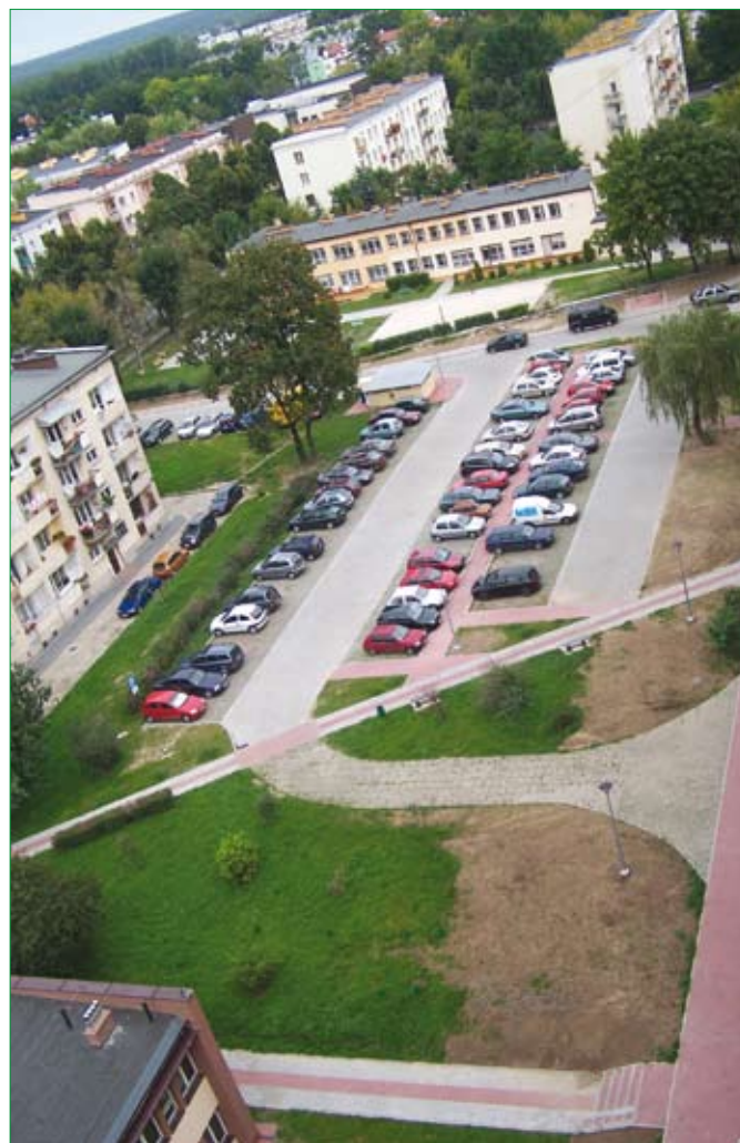
Na ul. Nowowiejskiej 5 powstało 73 miejsca postojowe

W ramach ustawy samorządy mogą ustalić standardy urbanistyczne, dostosowujące zapisy do lokalnych uwarunkowań. Chodzi np. o odległość od szkół czy wysokość budynków, a